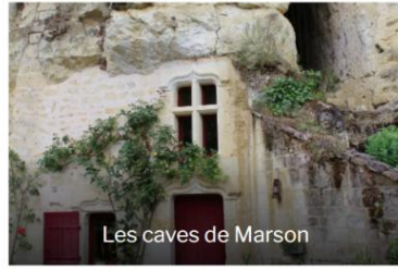
Les caves de Marson