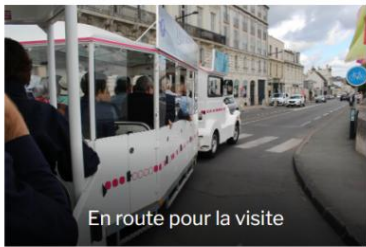
En route pour la visite