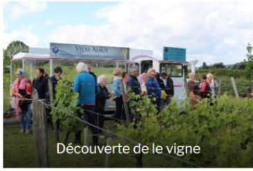
Découverte de le vigne