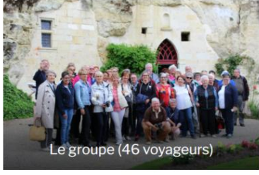
Le groupe (46 voyageurs)