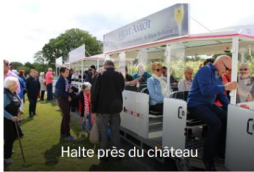
Halte près du château