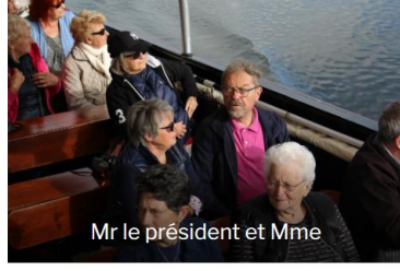
Mr le président et Mme