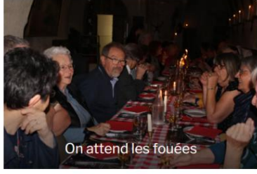
On attend les fouées