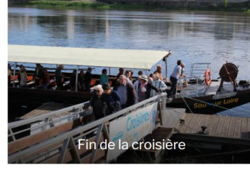
Fin de la croisière