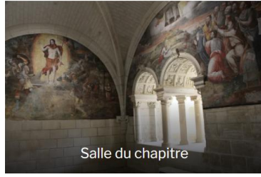
Salle du chapitre