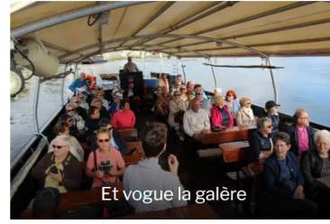
Et vogue la galère