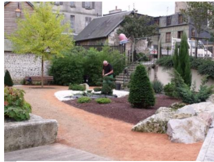
Le jardin du Tripot