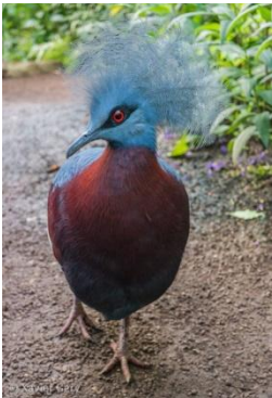
Gourea de Scheepmaker

le Naturospace est un zoo pas comme les autres, milieu tropical 100% original. Sur 200 m de sentier, un lieu couvert et climatisé de 1000 m 2 . Découverte d'une nature luxuriante, d'oiseaux exotiques de papillons tropicaux volants en toute liberté autour de vous.