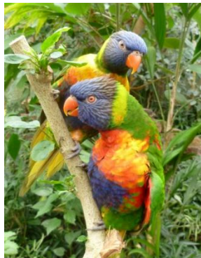
Loris de Swainson