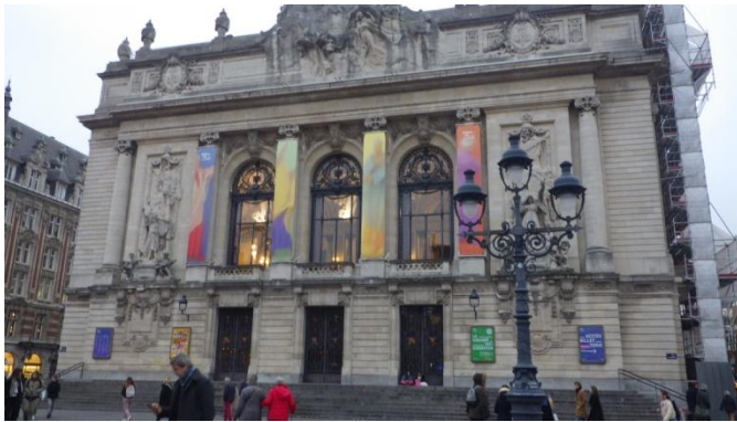
L'opéra sur la grand 'Place