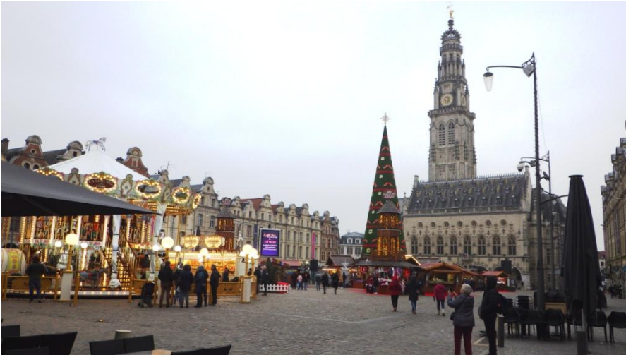
La Place des Héros sur laquelle s'élève le Beffroi et l'Hôtel de Ville gothique entouré de maisons de style baroque flamand. toutes sont inscrites en tant que monuments historiques