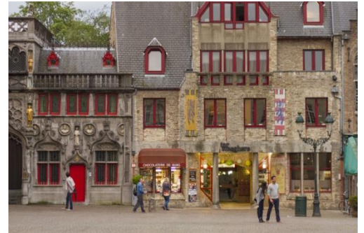
L'hôtel de ville et la basilique du Saint-Sang