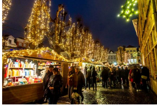
Le 4 décembre retour vers la Normandie avec un détour par Arras capitale historique de l'Artois