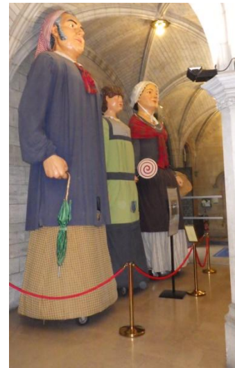
A l'intérieur de l'hôtel de ville les géants attendent leurs sorties annuelles.