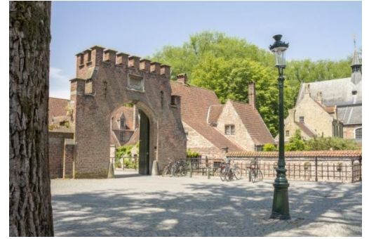
Le Béguinage et sa porte d'entrée, reste du rempart