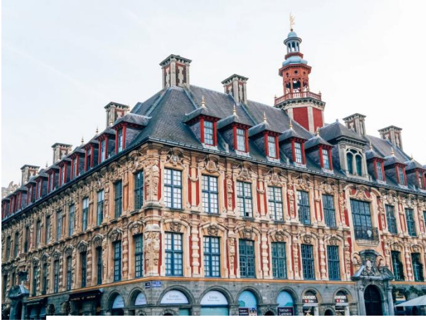
La vieille bourse