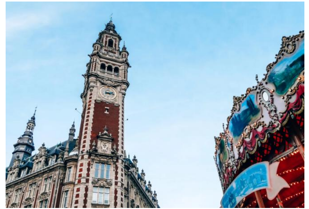
Beffroi de la chambre du commerce