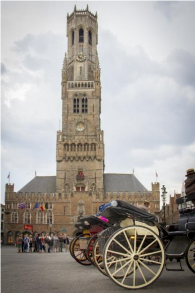
le beffroi de Bruges dite « la tour de l'horloge »