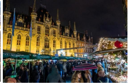
Le soir féerie sur la place centrale du Markt et la place Simon Stevin.