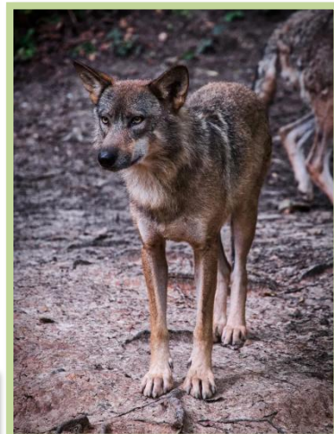
Les loups gris