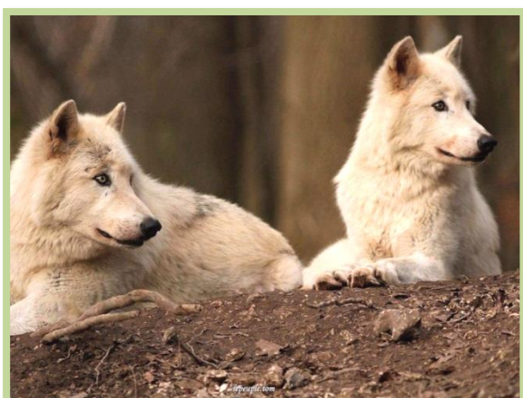
Les loups blancs